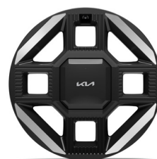
EV2 GT Line 19" aluminiumfälgar 225/45 R 19