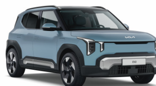
Frost Blue [EBU] solid EV2 / Plus / GT Line