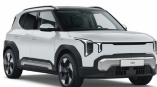
Deluxe White [HW2] metallic (pearleffekt) EV2 / Plus / GT Line