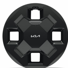
EV2 16" aluminiumfälgar 205/65 R16