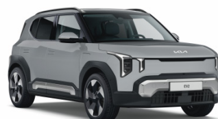
Wolf Gray [WAF] metallic EV2 / Plus / GT Line