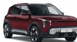
Magma Red [ARD] metallic EV2 / Plus / GT Line