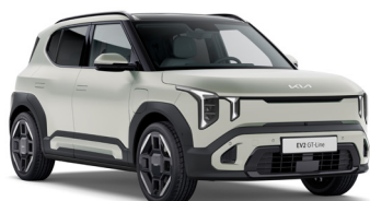
Ivory Silver Matt [IS4] GT Line (OBS! Kräver handtvätt)