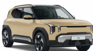
Vanilla Blossom [L3Y] metallic EV2 / Plus