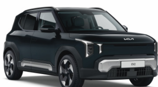
Black Pearl [1K] metallic (pearleffekt) EV2 / Plus