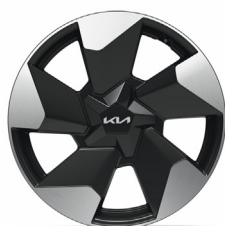
EV2 Plus 18" aluminiumfälgar 215/50 R 18