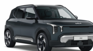
Penta Metal [H8G] metallic EV2 / Plus / GT Line