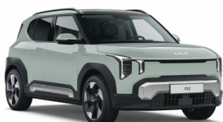
Morning Haze [DM8] solid EV2 / Plus / GT Line