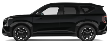
Fusion Black [FSB] metallic (pearleffekt)