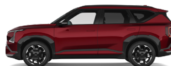
Magma Red [OVR] metallic