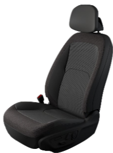
EV5 Plus Tyg / Konstläder