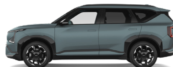
Iceberg Green [IEB] matt Endast GT Line (Obs! Kräver handtvätt)