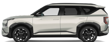
Ivory Silver [ISG] metallic