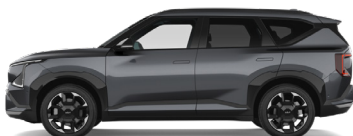
Gravity Gray [KDG] metallic