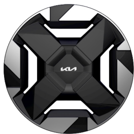
EV5 & EV5 Plus 18" aluminiumfälgar 235/60 R 18