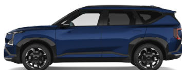
Dark Ocean Blue [BU3] metallic