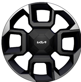
EV5 GT Line 19" aluminiumfälgar 235/55 R 19