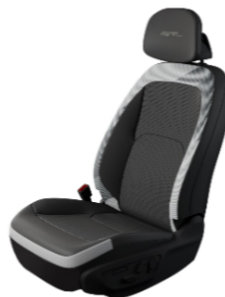
EV5 GT Line Konstläder