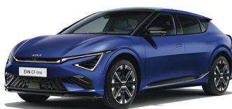
Yacht Blue [DUM] matt (endast GT Line) OBS! Handtvätt med special schampo