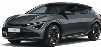
Interstellar Gray [AGT] metallic (ej GT Line)