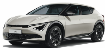
Glacier [GLB] metallic (ej GT Line)