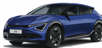
Yacht Blue [DU3] metallic (ej GT Line)