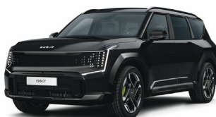
Aurora Black Pearl [ABP] metallic (pearleffekt)