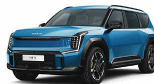
Ocean Blue [OBG] Glossy metallic (GT Line)