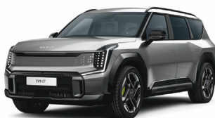
Pebble Gray [DFG] metallic