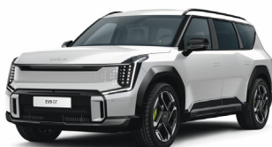
Snow White Pearl [SWP] metallic (pearleffekt)