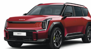
Flare Red [C7R] metallic