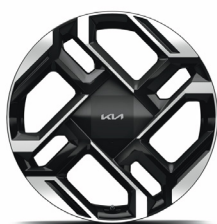
21" aluminiumfälg 285/45 R21