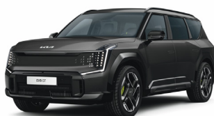
Panthera Metal [P2M] metallic

Kia Sweden AB Kanalvägen 10A 194 61 Upplands Väsby Sverige Tfn: 08 - 400 443 00 www.kia.com