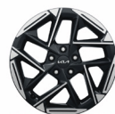
18" aluminiumfälg (GT Line)