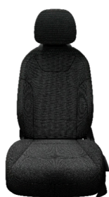
Svart interiör med svart konstläder. (Advance)