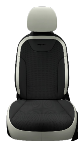
Svart interiör med svart/vit konstläder. (GT Line)